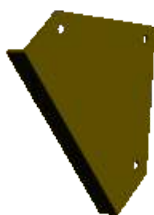
trokut za pojačavanje konstrukcije