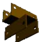
spojnica za križanje cijevi