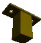
spojnica verikalne i vodoravne cijevi